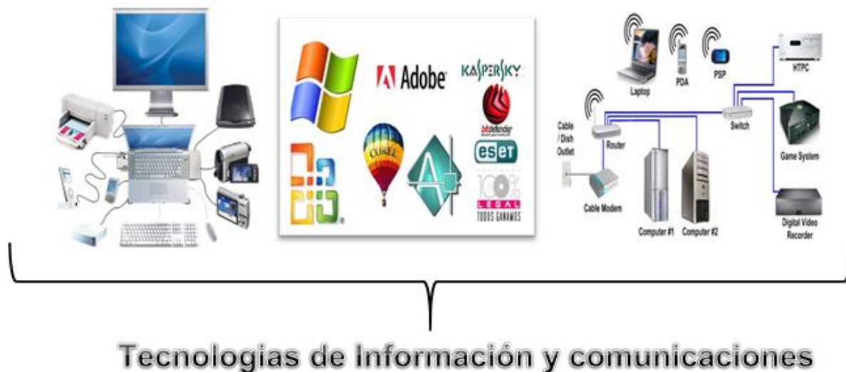
Figura 1. Elementos que forman parte de las TIC.