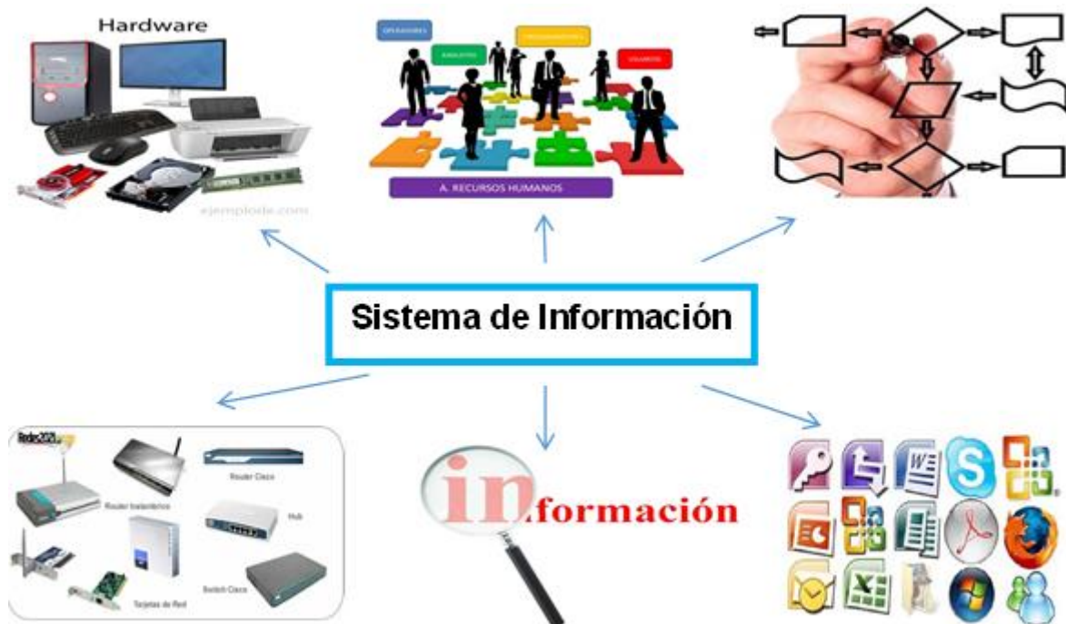
Figura 4. Elementos que integran un sistema de información

Con el propósito de aplicar correctamente esta metodología para realizar la auditoría de sistemas de TI, la cual puede ser aplicable para cualquier campo del área de sistemas e informática, a continuación se presentan todas las fases y pasos que se deben seguir para determinar la correcta funcionalidad de los recursos informáticos.