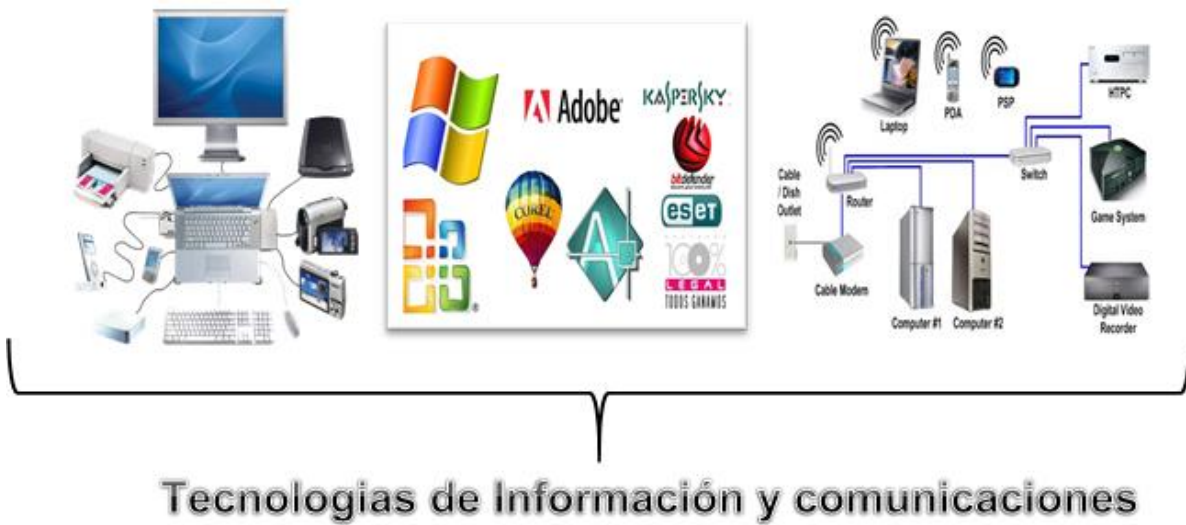
Figura 1. Elementos que forman parte de las TIC.