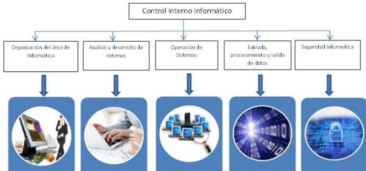
Figura 2. Funciones del control interno informático